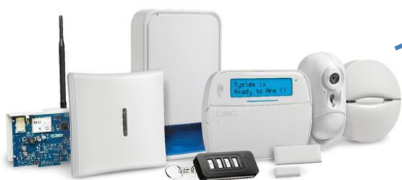
Sistema PowerSeries NEO