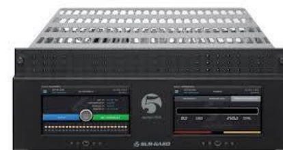
Receptora Sur-Gard System I, II, III, 5