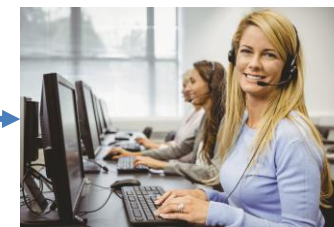
Central de Monitoreo de Alarmas