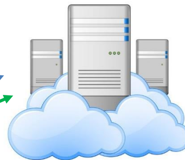
Servidor en la nube Connect.tycomonitor.com